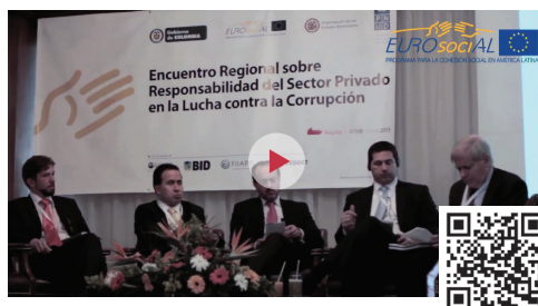
Foro de buenas prácticas sobre lucha anticorrupción