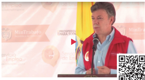
Inauguración de la Red de servicios públicos de empleo de Colombia con el presidente Santos