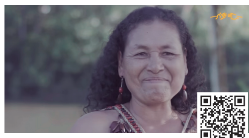
Lucha contra la violencia de género en América Latina