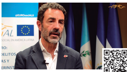
Miguel Lorente: el Compromiso de EUROsociAL en la lucha contra la violencia de género