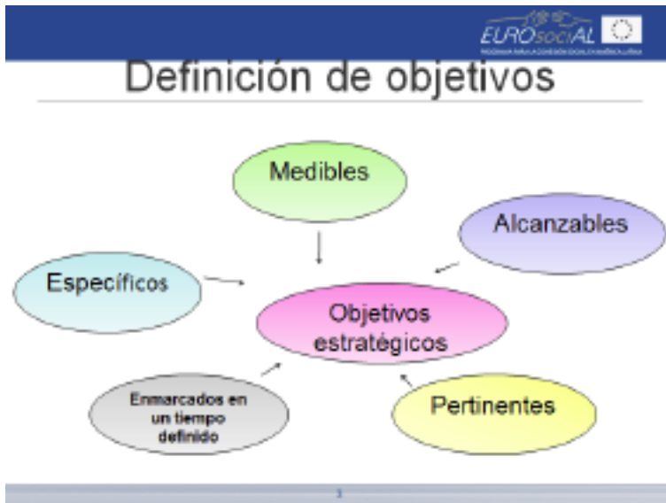
Ejemplo de diapositiva utilizada en la capacitación del grupo representativo