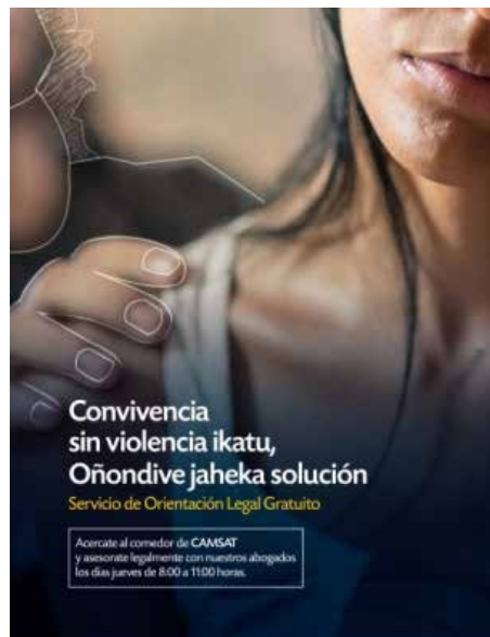
Ejemplo de afiche realizado a raíz del taller participativo.

Los vecinos que participaron en la definición de contenidos fueron mantenidos al tanto de los desarrollos en la producción de los materiales identificados en el taller y algunos de ellos participaron directamente en la grabación de las cuñas de radio, garantizando así la pertinencia de los acentos de las locuciones