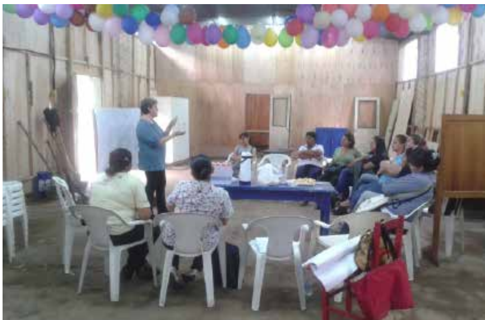
Bañado Tacumbú, Asunción, Paraguay.