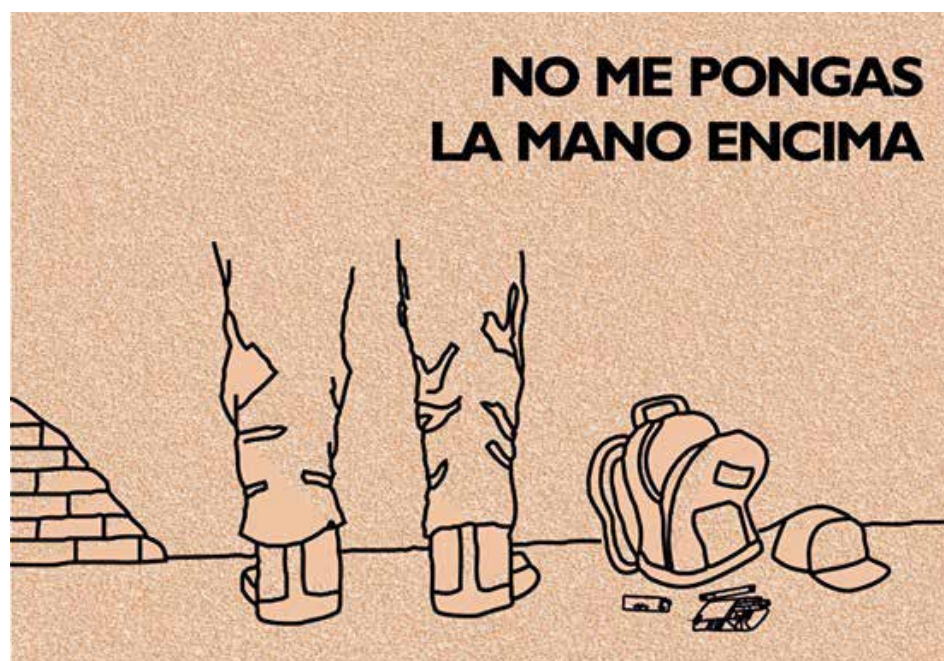
Mensaje y gráfica desarrollados de forma participativa.

Una vez ideada la campaña y formulados los mensajes, los jóvenes se están encargando de la producción de los materiales informativos así como de la organización de los eventos en los barrios. Gracias a una capacitación en teatro, están creando y realizarán ellos mismos su propia obra de teatro callejero.