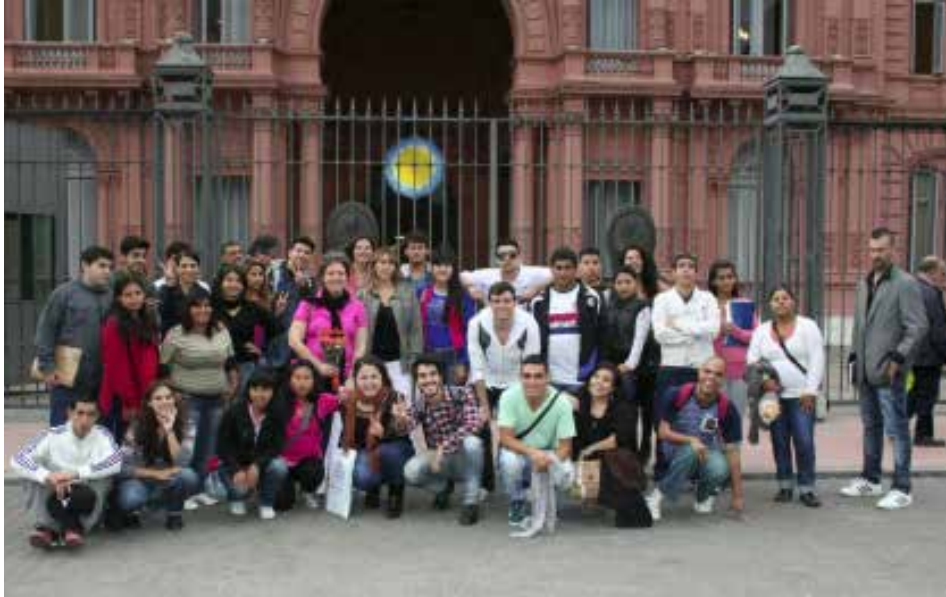
Grupo de jóvenes, Buenos Aires, Argentina.

factor de vulnerabilidad, entre otros). Estos jóvenes entre 18 y 24 años, quienes anteriormente habían abandonado los estudios, participaban en el Programa “Jóvenes con más y mejor trabajo” promovido por el Ministerio de Trabajo, Empleo y Seguridad Social de la República Argentina con el fin de “generar oportunidades de inclusión social y laboral de los jóvenes, a través de acciones integradas, que les permitan construir el perfil profesional en el cual deseen desempeñarse, finalizar su escolaridad obligatoria, realizar experiencias de formación y prácticas calificantes en ambientes de trabajo”. 10 En concreto, los 40 participantes en el taller se desempeñaban en los Centros de Acceso a la Justicia instalados por el Ministerio de Justicia y Derechos Humanos en varios barrios carenciados de la capital federal, donde viven. En estos Centros, que por primera vez acercan físicamente el Estado a los estratos más vulnerables de la población, los jóvenes participantes en el programa adquieren experiencia laboral y aportan su conocimiento del barrio y su red de relaciones con sus habitantes.