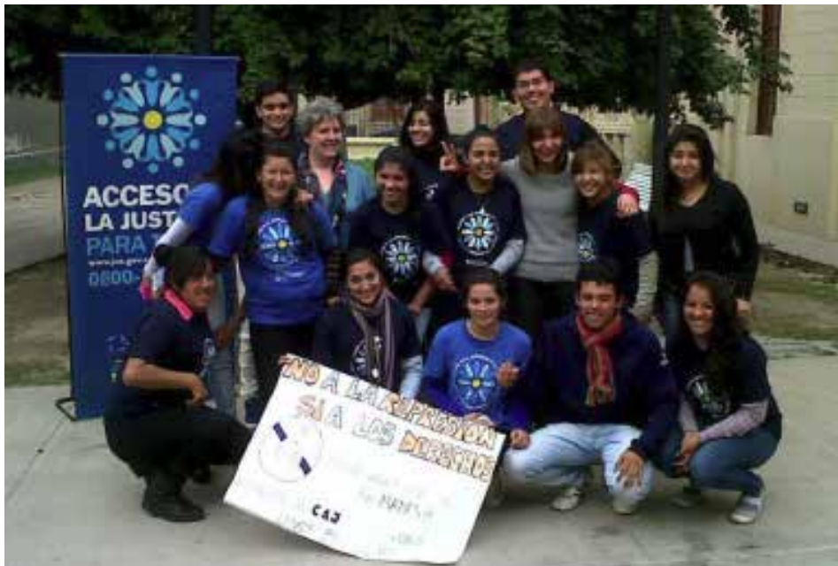
Grupo de jóvenes, Santiago del Estero, Argentina

Productos: murales, obra de teatro callejero, volantes, afiches, página en Facebook 13