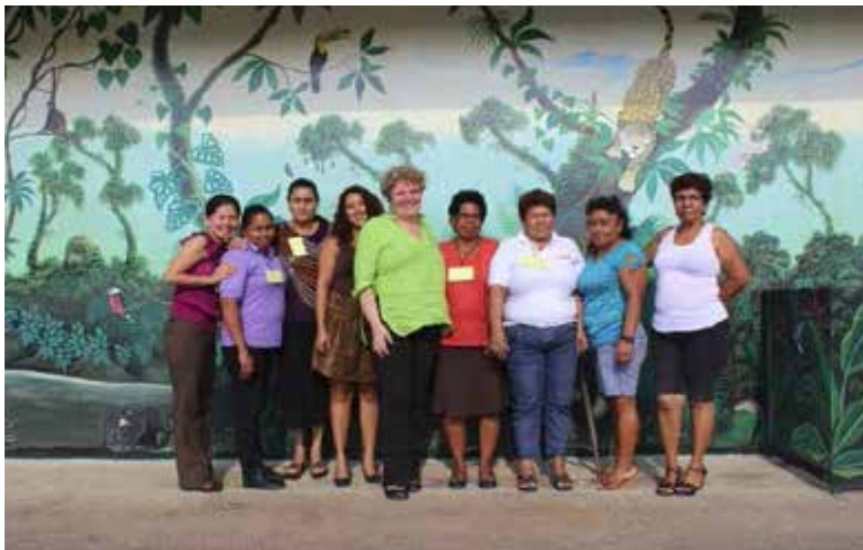
Cantón de Upala, Costa Rica.