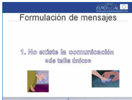
Ejemplos de diapositivas utilizadas en la capacitación del grupo interactivo representativo