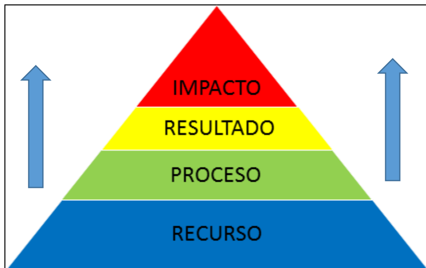
Figura 1: Esquema modelo de medición de transparencia

Informe FINAL: fase 5 (producto 4) - Proyecto de Modelo de medición Internacional de Transparencia para la RTA | Gloria de la Fuente