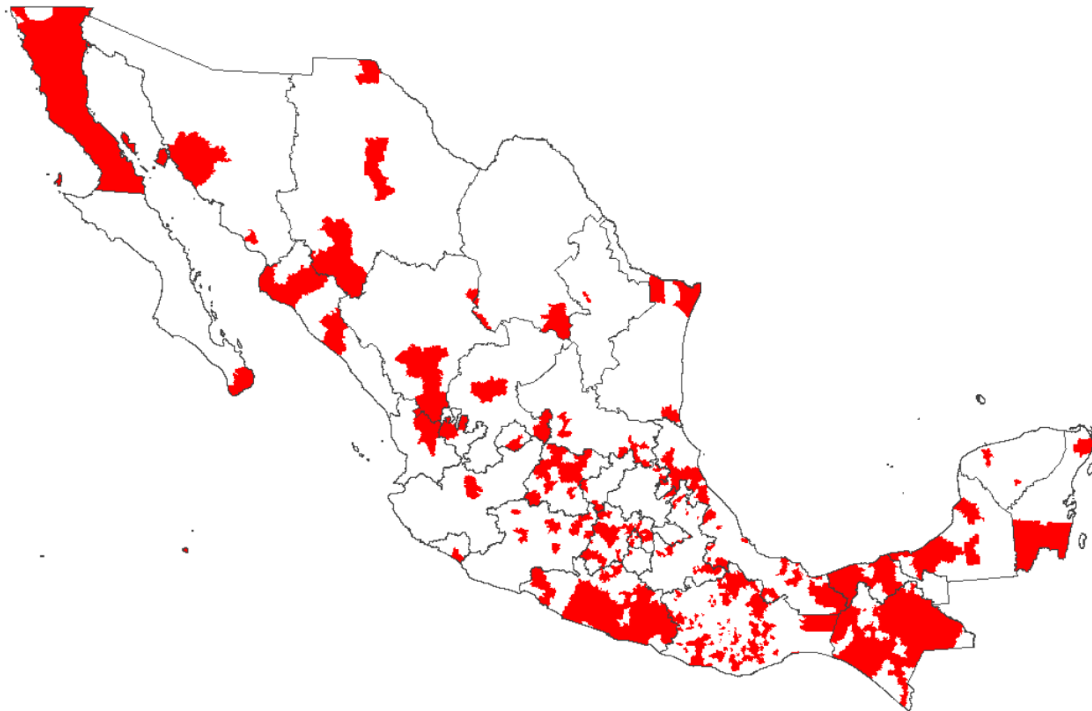
Figura 5. Ubicación geográfica de los 400 municipios prioritarios de la CNCH