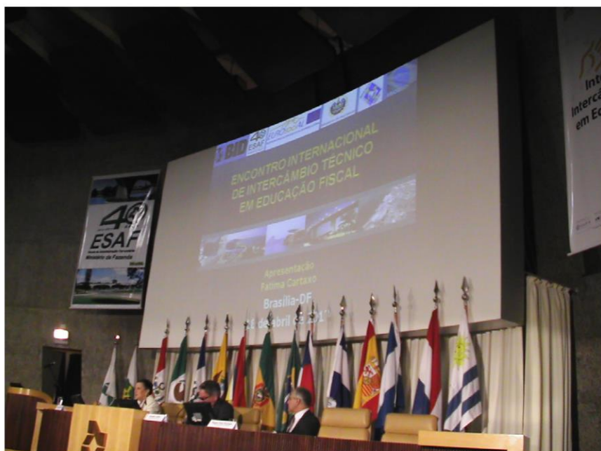
Presentaciones, Encuentro Internacional de Intercambio Técnico en Educación Fiscal.