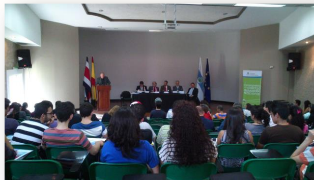
Inauguración NAF, UCR