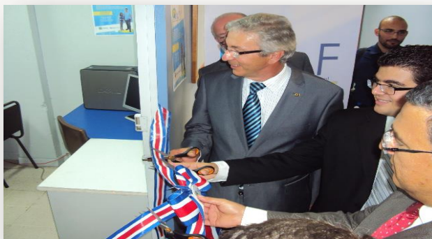
Inauguración NAF, UCR

9 estudiantes de contaduría y dirección de empresas y 2 voluntarios