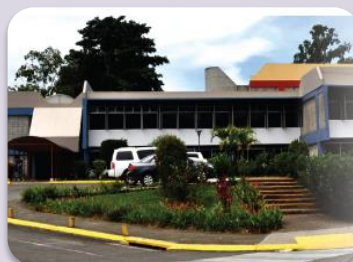
Instituto Tecnológico de Costa Rica