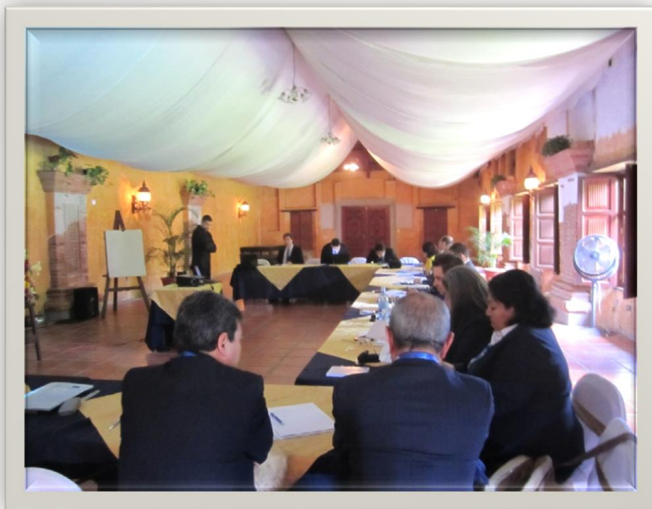
Presentaciones, Asesoría especializada para la creación de NAF, Anitgua Guatemala.