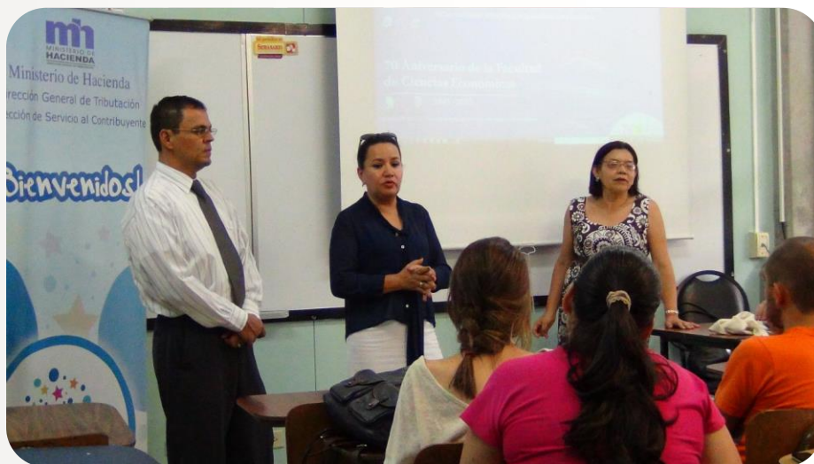
Capacitación estudiantes, NAF-UCR