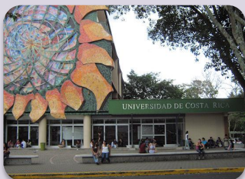
Universidad de Costa Rica

Tres universidades estatales y una privada.